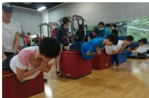
图 3 背肌耐力测试示意图

测试要求：被测者俯卧在长凳或跳箱上，躯干悬空，髂前上棘置于长凳或跳箱边缘，双手交叉放在胸前，用皮带固定住小腿，或者由同伴帮助固定小腿，保持身体在一个平面上。记录运动员保持身体位置的时间，如果身体不能保持在一个平面时，进行一次提醒，如果仍然无法达到要求，即测试停止，如果运动员维持时间达到 100s 时，可以停止测试，计为满分，计量单位为秒，精确到整数。