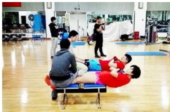
图 2 腹肌耐力测试示意图

持身体不低于水平面，可适当高于水平面，但不得超过 30 度。记录运动员保持身体位置的时间，如果身体低于水平面时，进行一次提醒，如果仍然无法达到要求，即测试停止，如果运动员维持时间达到 100s 时，可以停止测试，计为满分，计量单位为秒，精确到整数。